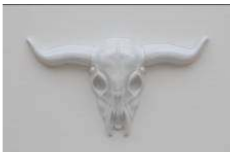
09. Nicolas Pasche Sans titre Masque animalier en plastique blanc Musée des beaux-arts de La Chaux-de-Fonds