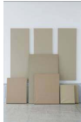
16. Frédéric Sanchez (né en 1966, France) Première livraison , 2009 Série de 8 acryliques sur toile Musée des beaux-arts de La Chaux-de-Fonds