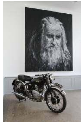
02. Yan Pei-Ming (né en 1960, Chine) Olivier Mosset , 2009 Huile sur toile Collection de l'artiste