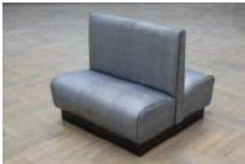
03. John Armlerder (né en 1948, Suisse) Diner Booth , 1988 Banquette en bois et Skaï argenté Musée des beaux-arts de La Chaux-de-Fonds