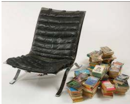
15. Gavin Brown (né en 1964, Australie) Sans titre , 1994 Installation comprenant un fauteuil en cuir noir /métal et des livres Musée des beaux-arts de La Chaux-de-Fonds