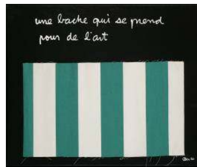
08. Ben Vautier (né en 1935, Italie, France) Une bache qui se prend pour de l'art , 1993 Peinture sur toile avec collage d'une toile (Buren) Musée des beaux-arts de La Chaux-de-Fonds