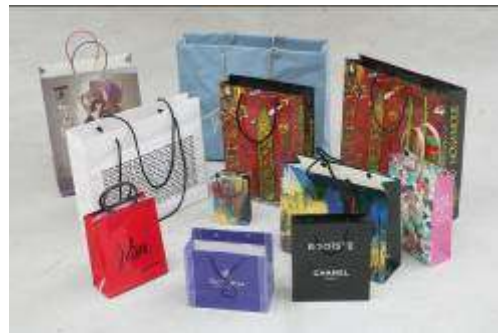
06. Sylvie Fleury (née en 1961, Suisse) Egoïste , 1991 Shoppings bags Musée des beaux-arts de La Chaux-de-Fonds