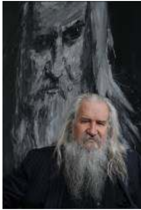
01. Olivier Mosset devant son portrait par Yan Pei-Ming