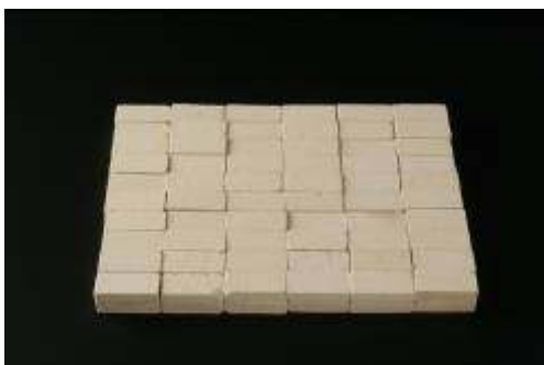
11. Carl André (né en 1935, USA) Minstar VII , 1995 Briques de céramique Musée des beaux-arts de La Chaux-de-Fonds