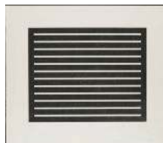
20. Donald Judd (1928-1994, USA) Sans titre, non daté Aquatinte sur papier vélin Musée des beaux-arts de La Chaux-de-Fonds