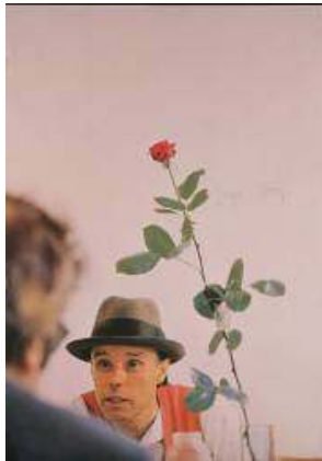
13. Joseph Beuys (1921 – 1986, Allemagne) Rose for direct democracy , 1973 Affiche signée Musée des beaux-arts de La Chaux-de-Fonds