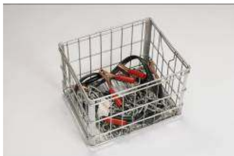
17. Cady Noland (née en 1956, USA) Basket of action , 1988 Panier et chaînes métallique, câbles et pinces Musée des beaux-arts de La Chaux-de-Fonds