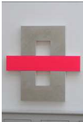
07. Mark Dagley (né en 1957, USA) Direct , 1987 Acrylique métallisé, fluorescent et résine sur toile Musée des beaux-arts de La Chaux-de-Fonds