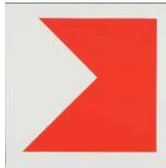
04. Christian Floquet (né en 1961, Suisse) Sans titre , 1989 Acrylique sur toile Musée des beaux-arts de La Chaux-de-Fonds