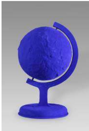
05. Yves Klein (1928-1962, France) La Terre bleue , 1957/1988 Pigment bleu (IKB), résine, boîte en plexiglas Musée des beaux-arts de La Chaux-de-Fonds

Rue des Musées 33 | 2300 La Chaux-de-Fonds | Suisse T ++41 32 967 6077 – Fax ++ 32 722 0763 E-mail : vch.mba@ne.ch | site Web : http://cdf-mba.ne.ch