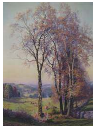
Edouard Jeanmaire Automne. Mont du Jura Huile sur toile, 1908 Collection privée