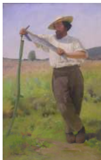
Gustave Jeanneret Faucheur Huile sur toile, 1889 Dépôt des collections Jeanneret Musée d'art et d'histoire, Neuchâtel