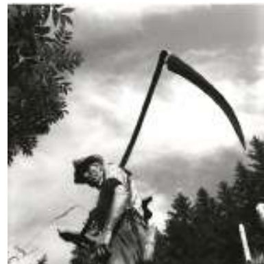
Les foins à Bellegarde 1988