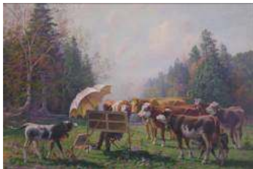
Edouard Jeanmaire Jury de peinture Huile sur toile, non datée Collection Commune de Couvet, Fonds Duval