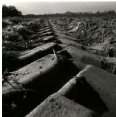
Sans titre, 1992

Les vingt photos de l'exposition sont le fruit d'un long reportage sur les paysans de montagne en Suisse Romande, réalisé dans la première partie des années 90, qui rend compte de l'adaptation de leur mode de vie aux contraintes de la vie moderne. Ils ont fait l'objet d'une publication aux éditions de la Sarine en 1997 sous le titre Paysans , accompagnés de textes de Didier Schmutz.