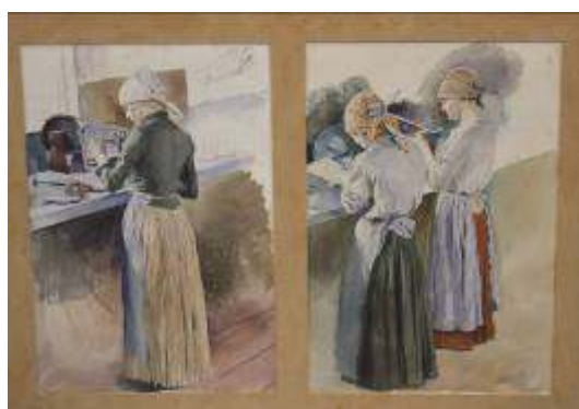
Etudes pour les peintures murales de la cage d'escalier du Musée d'art et d'histoire de Neuchâtel Lavis, vers 1880 - 1891 Musée d'art et d'histoire, Neuchâtel