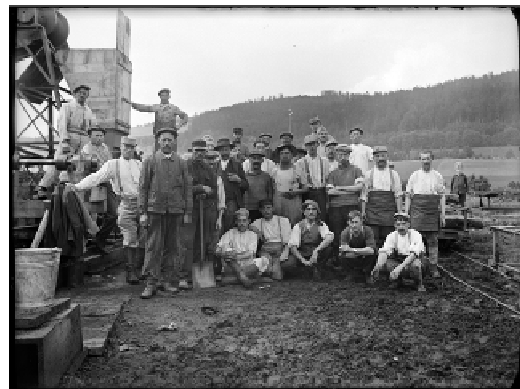
Internés malaxeurs à proximité de la machine dans les tourbières des Ponds-de-Martel.