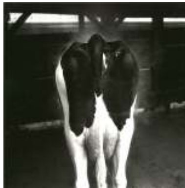
Expos Bulle, 1994

Collection de l'artiste, © VU' La Galerie, Paris