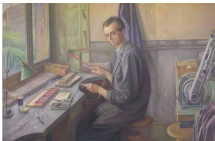
Aurèle Barraud (La Chaux-de-Fonds 1903 – 1969 Genève)