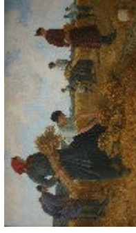
Les Glaneuses, Gustave Jeanneret