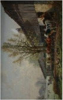
Sortie de l'étable, Edouard Jeanmaire

14. Nomme tous les animaux que tu trouves :