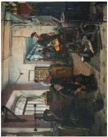
Les barons, Edouard Kaiser

17. Quel est le métal que l'ouvrier est en train de fondre?